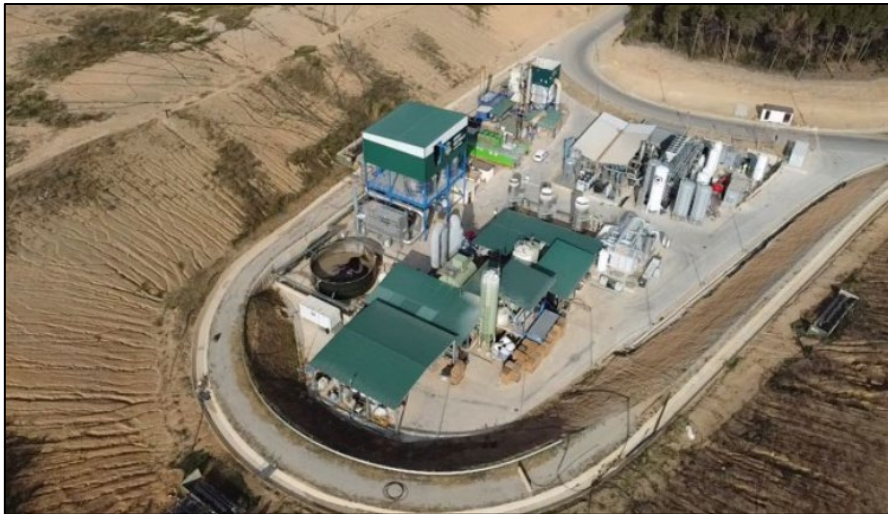
Situé à une quarantaine de kilomètres de Barcelone, Can Mata est l'un des plus importants sites de stockage des déchets en Espagne.

PreZero, l'un des principaux acteurs du traitement des déchets et des services environnementaux en Espagne, et Waga Energy, spécialiste de la production de biométhane sur les sites de stockage des déchets, ont démarré le 20 juin une unité de production de biométhane sur le site de Can Mata, situé à Els Hostalets de Pierola, à une quarantaine de kilomètres de Barcelone (Catalogne). Sa production de gaz renouvelable est injectée directement dans le réseau de Nedgia, distributeur de gaz du groupe Naturgy, grâce à un raccordement de six kilomètres réalisé dans le cadre de ce projet.